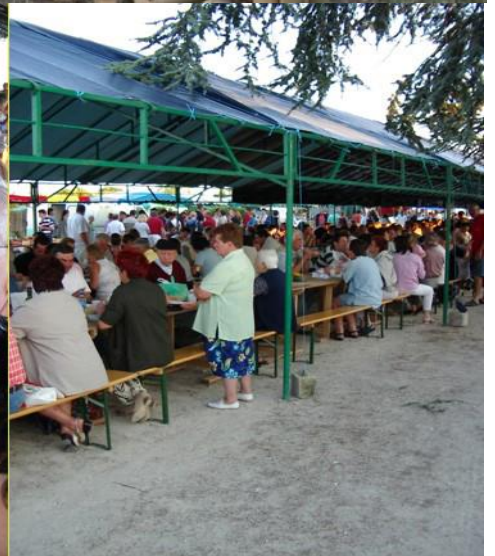
2500 repas le soir 2004 07 04