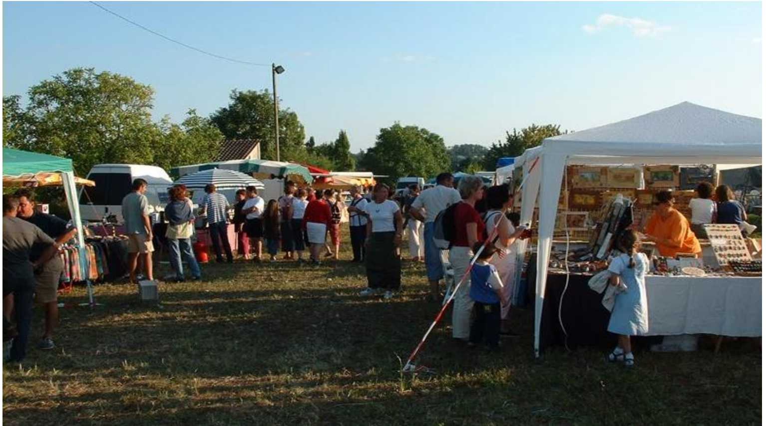
Lancement du marché de nuit de Julienne 2004 07 04