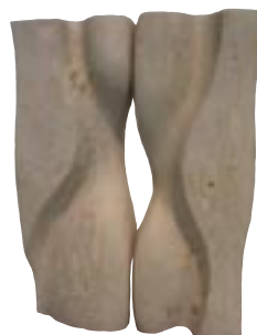
Tatsumi SAKAI Japon 2,50 x 1,80 x 1,20 m