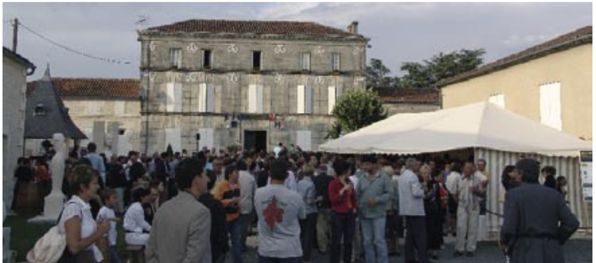
Vernissage de l'exposition