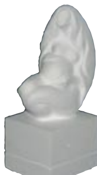
Vitali PANOK Biélorussie 2,35 x 1,20 x 0,90 m