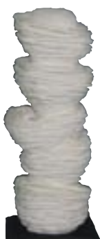
Gadadhar OJHA Inde 2,40 x 0,70 x 0,70 m