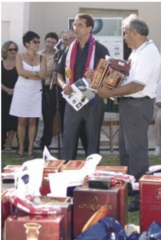
Remise des prix