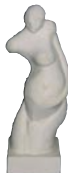
Alain HUTH France 2,10 x 0,80 x 0,70 m