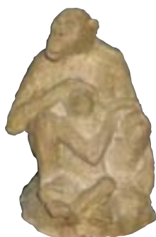
Olivier DELOBEL France 1,60 x 1,30 x 1 m

Après la réunion de notre comité de sélection, 8 sculpteurs ont été sélectionnés pour créer des œuvres monumentales.