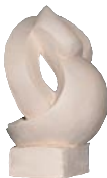
J-Claude ESCOULIN France 1,80 x 1,20 x 1 m