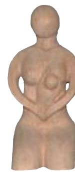
Charly SALLE France 2,30 x 1,05 x 1,00 m