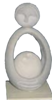
David KOCHAVI Israël 2,40 x 1,30 x 0,80 m